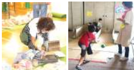
左:バザー(体育館) 右:ゲーム(ピロティ)